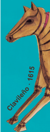
Clavileño · 1615