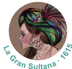
La Gran Sultana · 1615