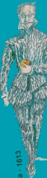
El Licenciado Vidriera · 1613

Cervantes y Shakespeare jamás se conocieron, o al menos así nos lo asegura la historia. No obstante, gracias al talento del escritor colombiano Nahum Montt, este encuentro ha sido posible en su novela Hermanos de tinta (Alfaguara, 2015). Una obra con mucho de novela de aventuras. Nahum nos hablará sobre el proceso creativo tras su libro más reciente. Por Nahum Montt