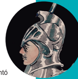
El Caballero de la Blanca Luna · 1615