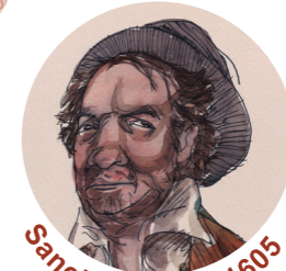
Sancho Panza · 1605