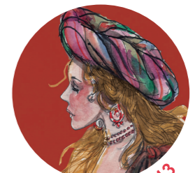
Preciosa · 1613