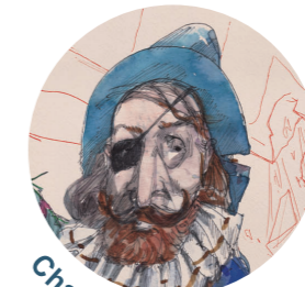
Chanfalla · 1615