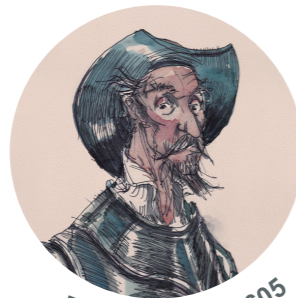
Don Quixote · 1605